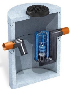
Oljeavskiljare i betong typ ESK-H

Installationsmanual och Drift- och underhållsanvisning '